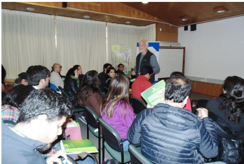
Curso de Restauración Ecológica previo al Seminario (28 de octubre 2015)